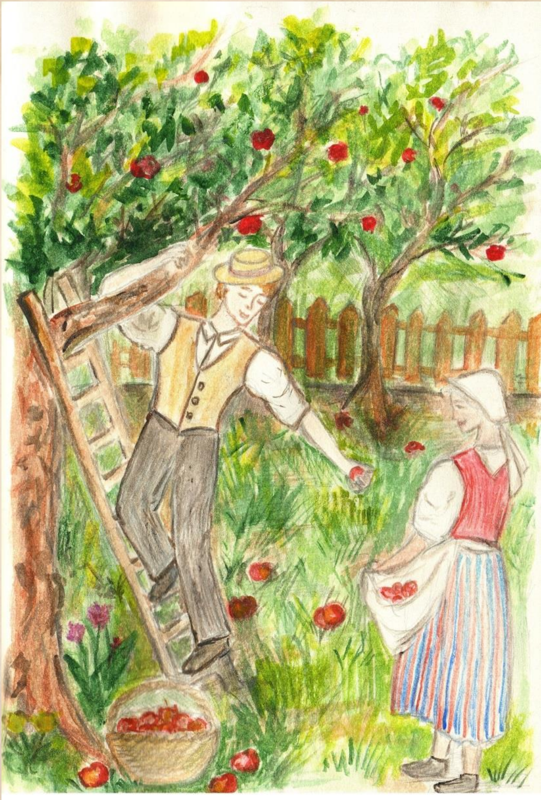
«В саду», Ирина Гетц «Im Garten», Irina Getz