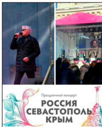
Праздничный концерт «РОССИЯ СЕВАСТОПОЛЬ КРЫМ»

18 марта сотрудники Новосибирского областного Российско-Немецкого Дома приняли участие в праздничном концерте в честь присоединения Крыма к России, который проходил в сквере Театра оперы и балета. Хедлайнером концерта стал популярный певец Александр Маршал.